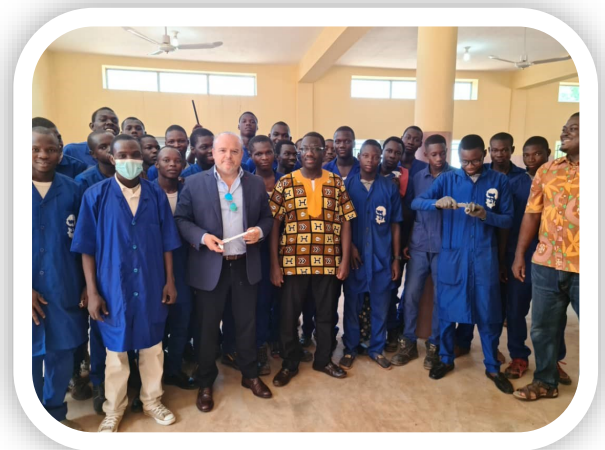
Visite officielle à Sikasso