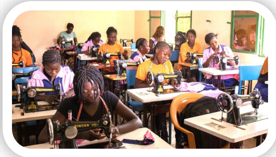
Formation en couture