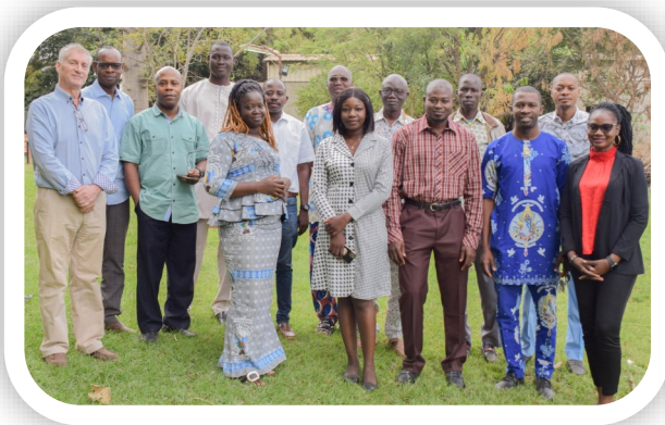
Rencontre nationale 2022 d'auto évaluation des parten- naires locaux d'exécution du programme VIA au Mali