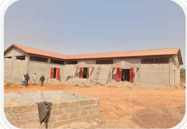
Bâtiment en chantier à Siguiiri - Guinée Conakry