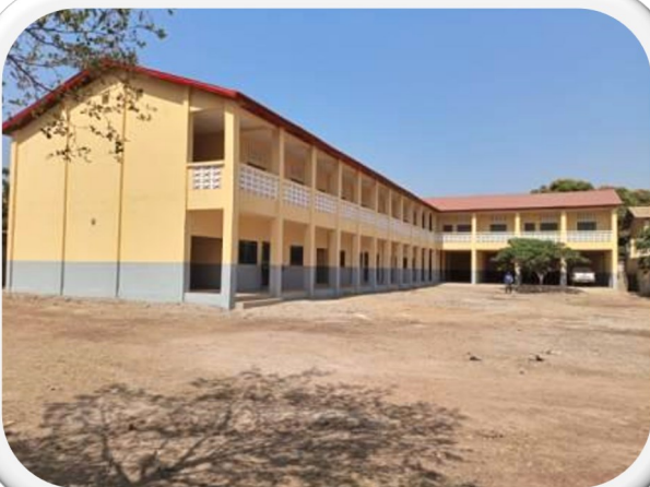
Bâtiment construit à Kankan - Guinée Conakry

Equipement de 2 ateliers de travaux pratiques