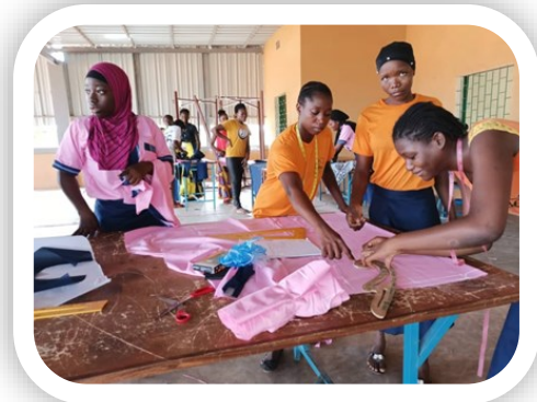
Formation en couture