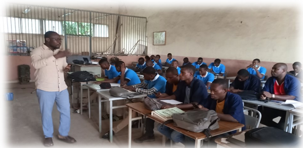
Cours de langue italienne/Mali

23 plans d'affaires d'apprenant(e)s qui sont avalisés par un comité