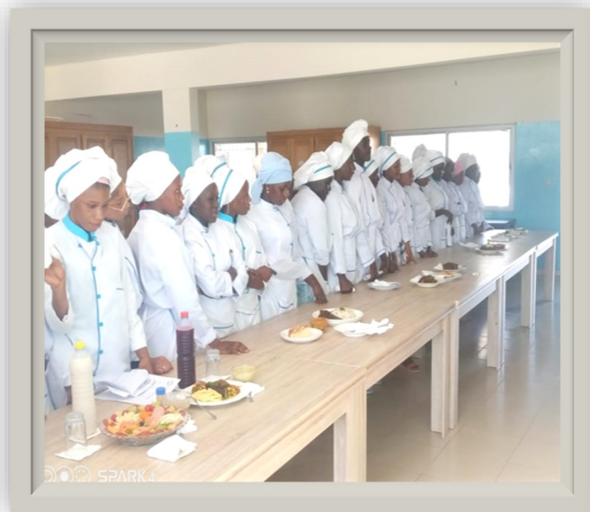
Formation en cuisine