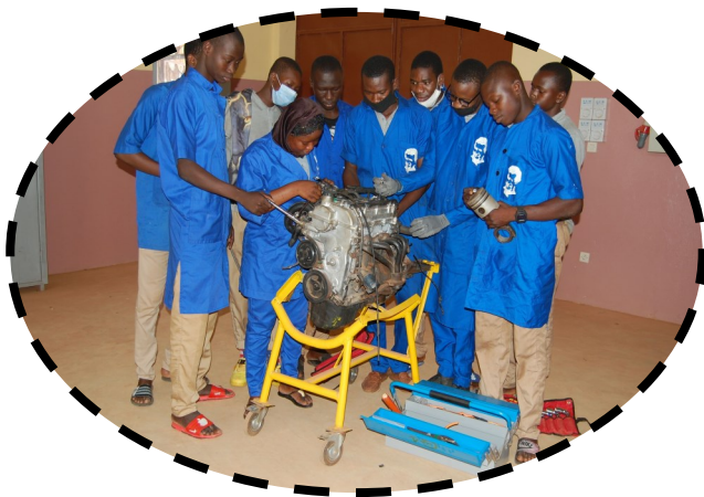
Formation en mécanique