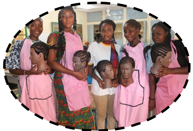
Formation en coiffure