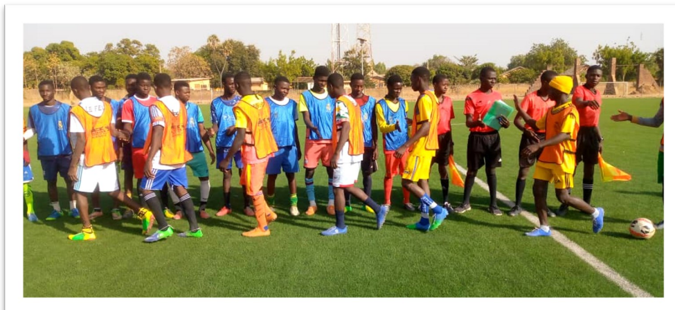
Tournoi de football Don Bosco/BENIN