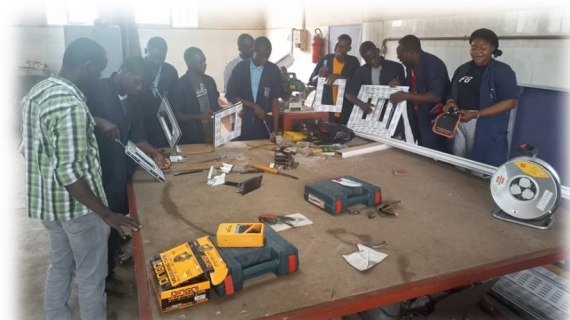
Formations techniques et professionnelles intégrées au Mali.