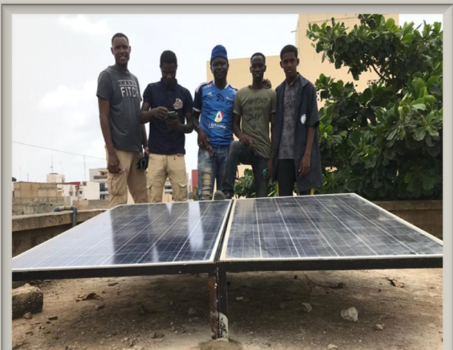
Formation en énergie photovoltaïque

Une formation de qualité pour un monde meilleur