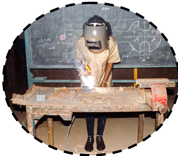
Activité pratique d'électricité